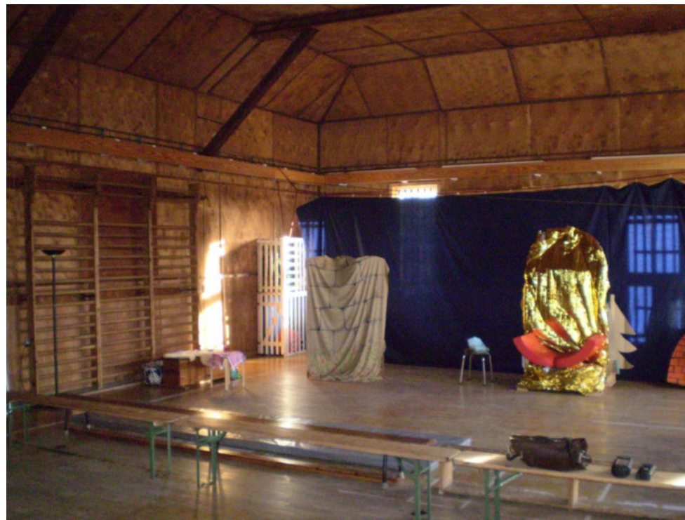
Abbildung 1 : Turnhallen Innenraum vor dem Umbau