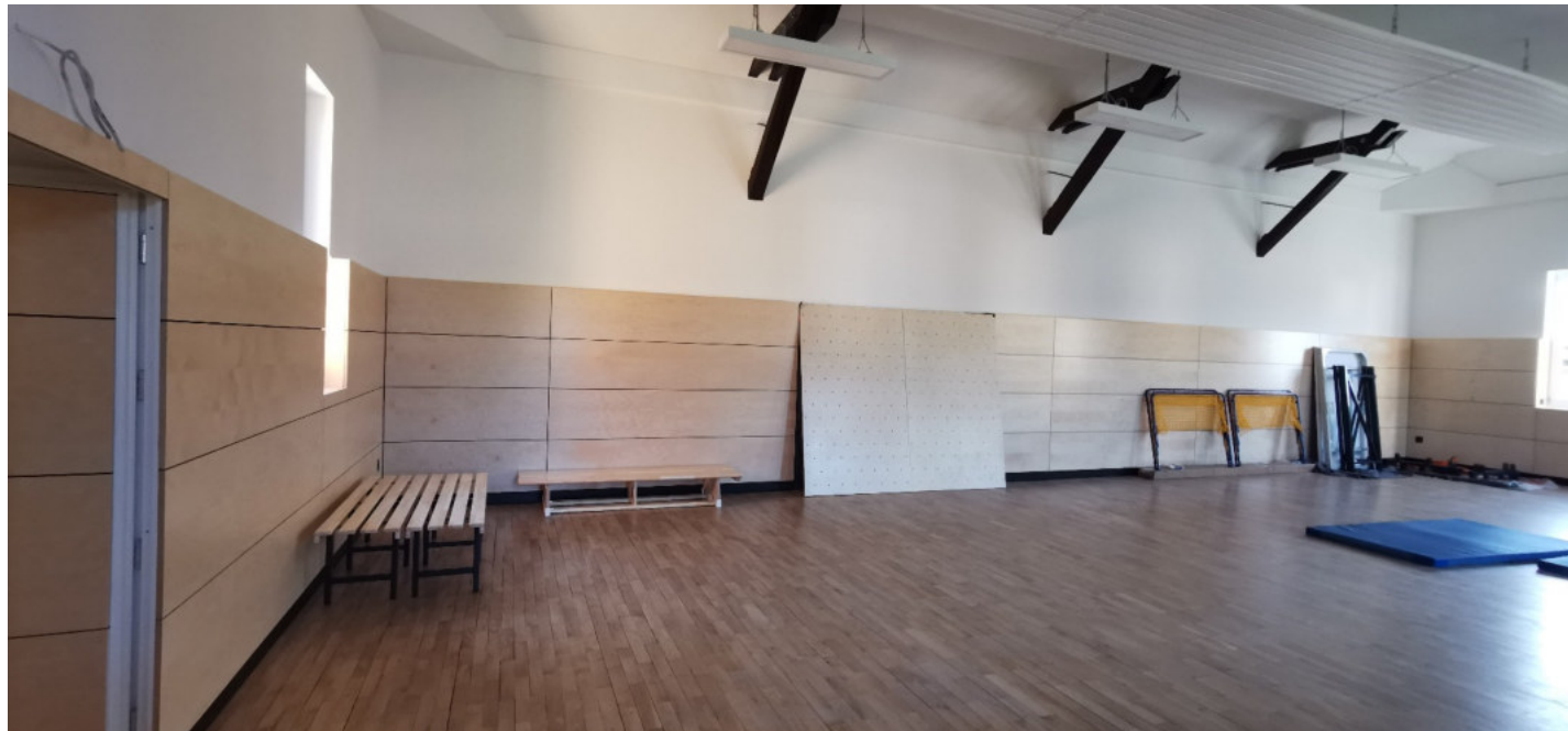
Abbildung 2: Turnhallen Innenraum jetzt