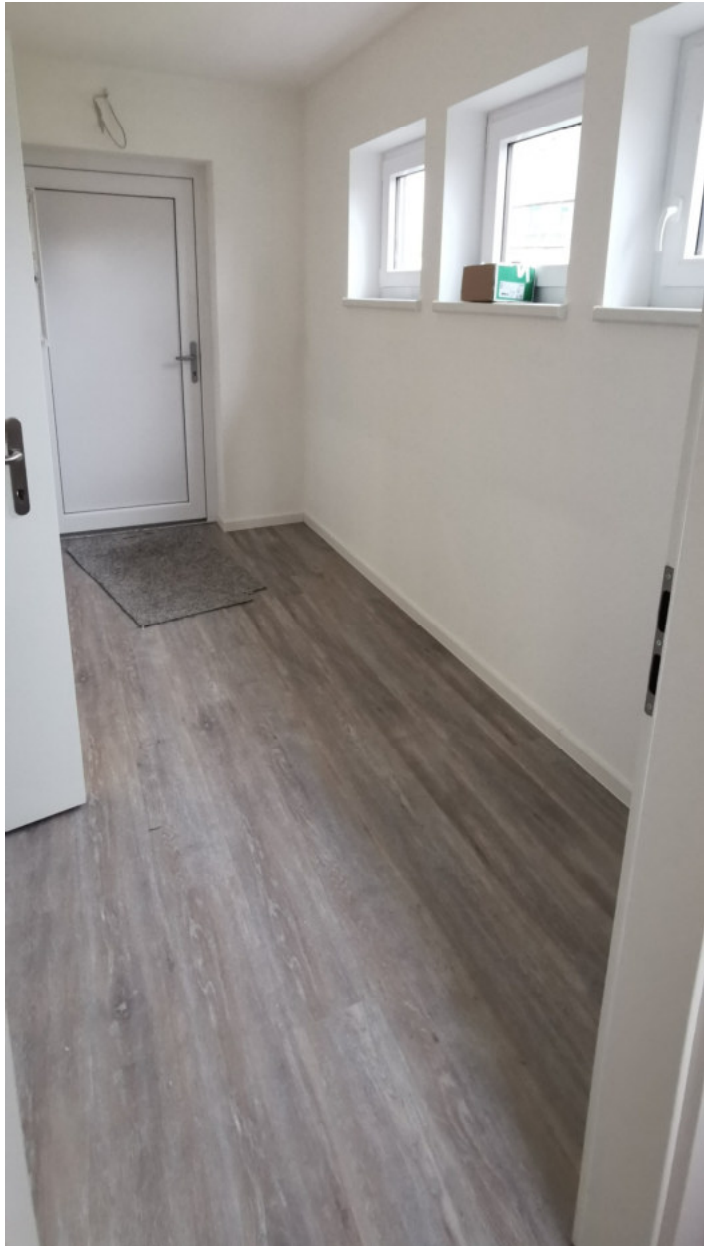
Abbildung 4: Vorraum / Eingang